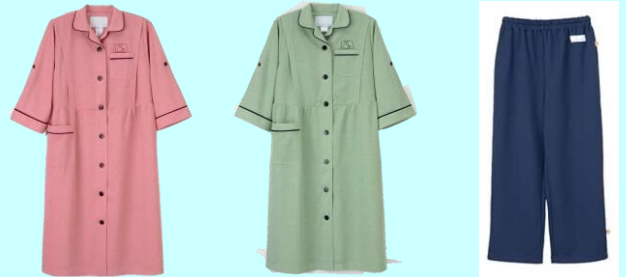
マタニティウェアM