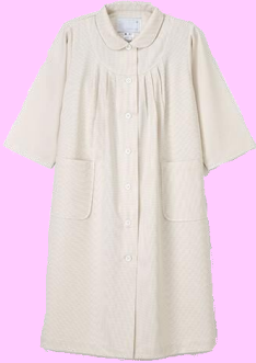
マタニティウェア